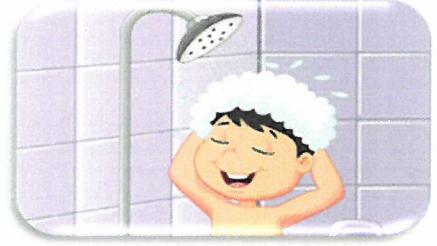
( نظافة البدن )

( ب ) عن أبي هريرة - رضي الله عنه - ، عن النبي - صلى الله عليه وسلم - قال: ﴿ ما يصيب المسلم من نصب ولا وصب ولا هم ولا حزن ولا أذى ولا غم حتى الشوكة يشاكها، إلا كفر الله بها من خطاياها ﴾. ص ٨٥