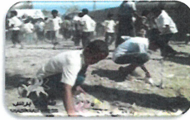
( نظافة المكان )